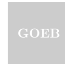
Gebruiksoppervlakte Externe Bergruimte